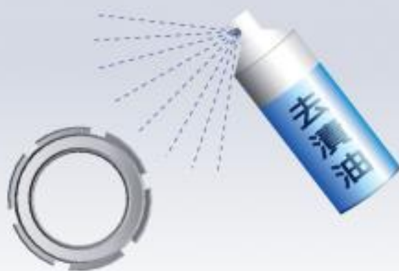
使用去漬油(清潔劑)清洗螺帽