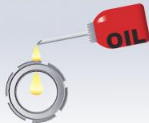
少量潤滑劑滴入內孔部位